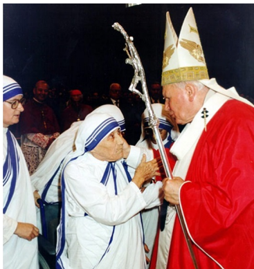
Папата Јован Павле II и Мајка Тереза

Мајчин јазик и' беше скопскиот (македонскиот) и хрватско-српскиот и не зборуваше друг јазик сè додека не отиде преку Загреб во Ирска каде учеше англиски јазик и од каде заминува за Калкута, тогашниот најголем град на Британската Империја по Лондон. Мајка Тереза пристигнала во Калкута на 6 јануари 1929 година и таму остана до крајот на својот живот. Двапати го посетила своето родно место Скопје, во Република Македонија.