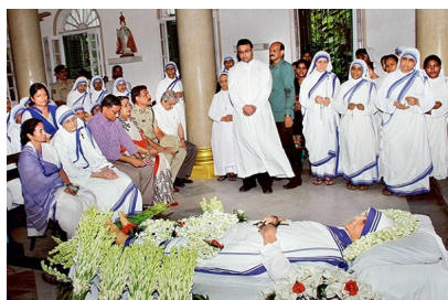
Од погребот на Мајка Тереза

Погребот на Мајка Тереза се изврши во Калкута, каде по богослужбата во црквата „Свети Томас“, всушност, започна погребната церемонија. Име-но, колата со ковчето на Мајка Тереза влезе во преполнетиот затворен стадион Нетаџи, кој, иако пре-полн со илјадници лица и високи државни функ-ционери, кралски и дипломатски претставници, за момент се исполни со тишина, како израз на ис-клу-чителниот респект кон животот и делото на го-ле-ми--от хуманист кој целиот свој живот го посвети на си---ромашните, на кои им подари добрина и љубов.