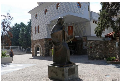
Домот на Мајка Тереза во Скопје

Од овој одговор јасно може да се заклучи дека јазикот на кој зборувала Мајка Тереза со нејзините домашни не бил ниту албански, ниту српски (јазик на кој учела), туку чисто „по скопски“, што значи, македонски! Колку се допирните точки со Албанија, нека послужи и овој пример. Во Осло, во декември 1979 година, Мајка Тереза пристигна со индиски пасош, а беше примена и придружувана од југословенскиот амбасадор, но не од албански. Веќе наредната година, како нобеловка дојде во својот роден град, дојде во Скопје.