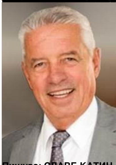
Пишува: СЛАВЕ КАТИН