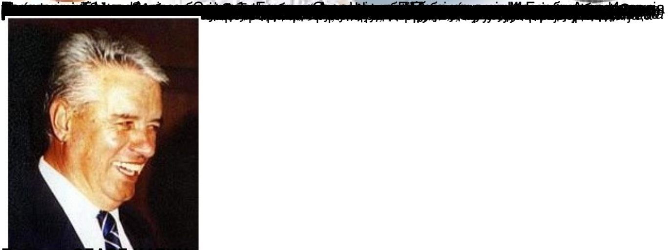
Пишува: СЛАВЕ КАТИН