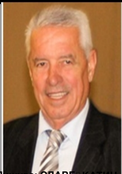
Пишува: СЛАВЕ КАТИН