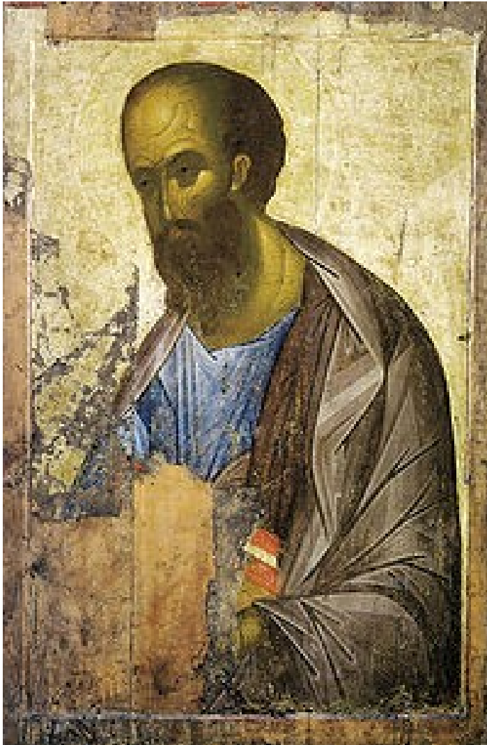
Св. Павле, икона од Андреј Рубљов, 1410 г.

Најтоплиот и најчувствителен мотиватор меѓу апостолите, Павле, им носел на Македонците уверување да не очајуваат кога се онеправдани, прогонувани и убивани, зашто Бог ќе им ги претвори трагедиите во триумф, бедата во богатство, болката во благослов, слабоста во слава, а поразот во победа. Тој тоа им го пишувал, а тие му верувале бидејќи го имале видено на дело влијанието на неговото учење во име на Бог Исус Христос.