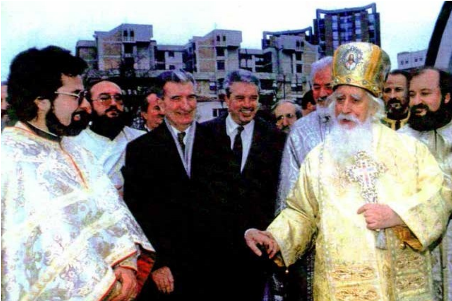
На прослава на Божик