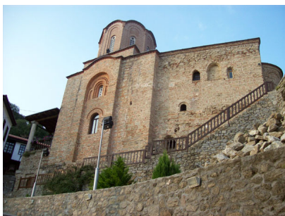
Манастирската црква, јужна страна

Конаците се изградени од двете страни на манастирот во XIX век, од страна на прилепскиот еснаф и претставуваат убав пример на староградска архитектура. Во дворот од манастирот се наоѓа извор со лековита вода, посветен на Света Богородица.