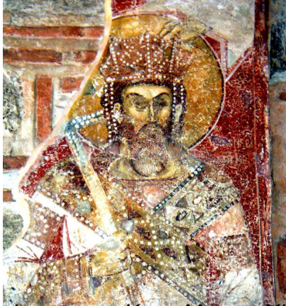
Фреска на Крал Марко, XIV век