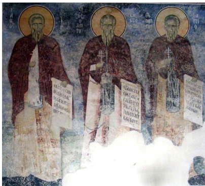
Фрески во црквата, XIV век