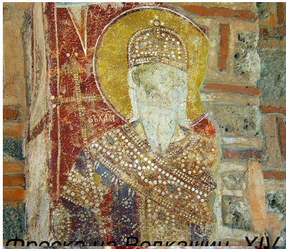
Фреска на Владкошич, XIV век