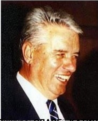
Пишува: СЛАВЕ КАТИН