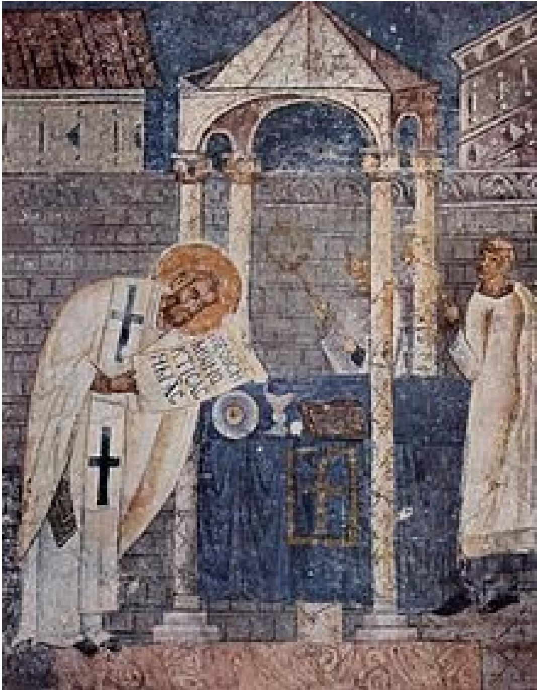
Фреска на Св. Василиј, катедрала Св. Софија ( 1035 - 1056 ), Охрид

Св. Василиј Велики напишал во 4ти век: „ Многу време изгубив на глупости и скоро цела младост потрошив на безначајности, посветен на лажни учења кои се