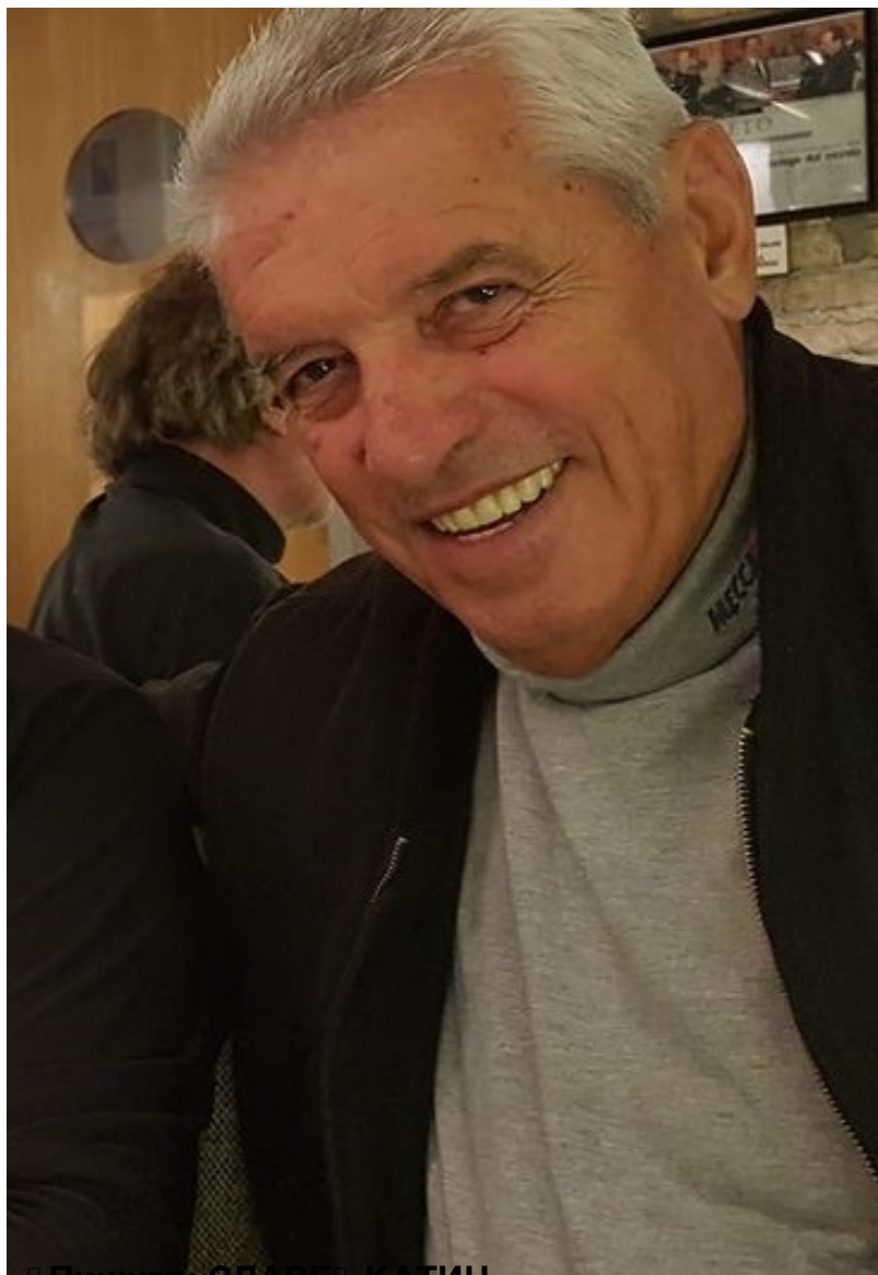
□ Пишува: СЛАВЕ □ КАТИН