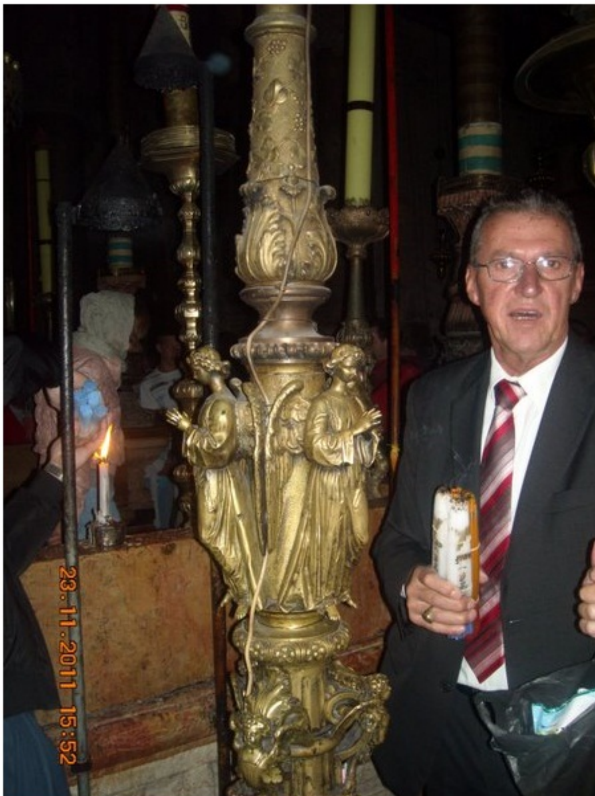
Воскресението на Исус Христос